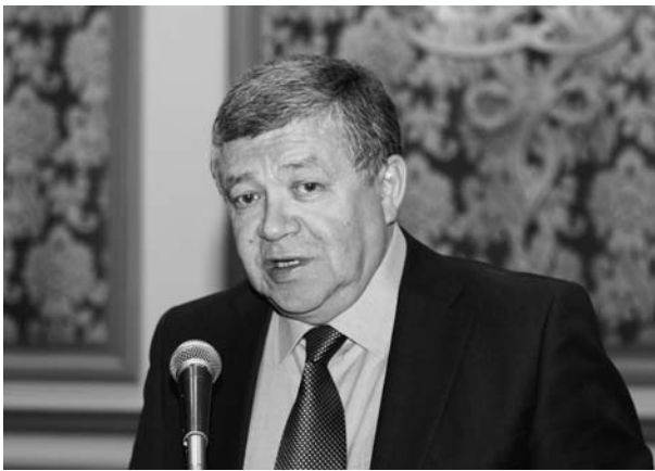
XXII IUE Meeting New Economy: Optimal Models XXII Собрание МСЭ