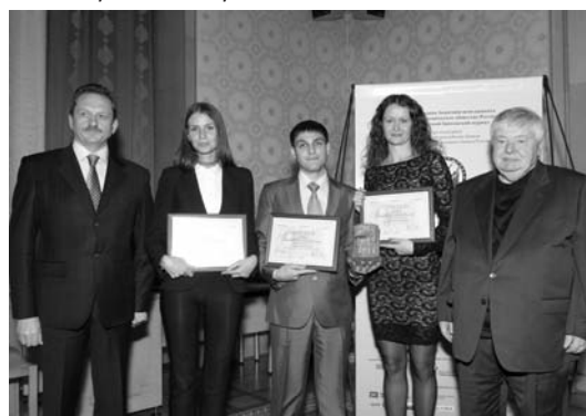
Bank KEDR is awarded in the Team of the Year nomination Вручение награды в номинации «Команда года» банку «КЕДР»

Г.Х. Попов , председатель оргкомитета Премии, президент ВЭО России, президент Международной Академии менеджмента, поздравил лауреатов и подчеркнул, что мир на главных участках своего развития оказался в глубоком и многолетнем кризисе, и в период обострения экономической ситуации во всем мире, разрастания экономических кризисов, как никогда важно принятие правильных управленческих решений, обеспечивающих устойчивость финансовых структур. Назрела необходимость изменения парадигмы поведения — от модели потребления к модели сбережения, что создаст задел для развития экономики на будущее. Именно состояние банковской системы определяет стабильность экономики в целом, возможность реализации важнейших инвестиционных проектов. Присуждение Премии является высокой оценкой труда руководителя, и в то же время это знак доверия со стороны банковского сообщества.