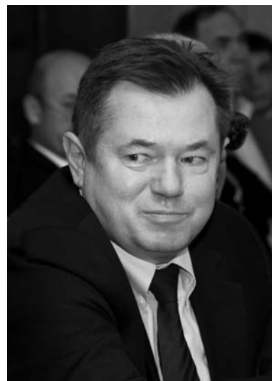
S.Yu. Glaziev is giving his speech Выступает С.Ю. Глазьев

Участники конференции: руководители Евразийской экономической комиссии, министерств и ведомств, регионов, финансовых организаций и высших учебных заведений, эксперты, представители государственных структур, бизнес-сообщества Российской Федерации и Республики Казахстан.