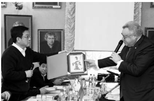
Handing of a memorable gift Вручение памятного подарка

An economic policy where social expenses are regarded as those of high investment importance supports crisis resistance. Therefore it is only an effective system of country's economic development that allows solving social problems, Wei Jianmin agreed with V.M. Davydov and told the audience about the measures taken by the Chinese Government to eliminate slum areas.